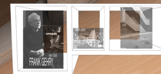
A4 LIBRO DE BOLSILLO GRANDE Y APAISADO 3 MODULOS PARA DISTINTOS TAMAÑOS DE LIBROS