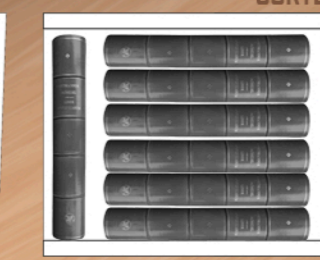
PRIMER LIBRO CON LA VISTA DE LA TAPA Y ALMACENAMIENTO DETRAS